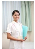
スタッフ教育研修・ 定着化