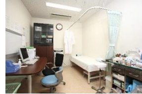
効率化・コスト削減と 医療機器の見直し